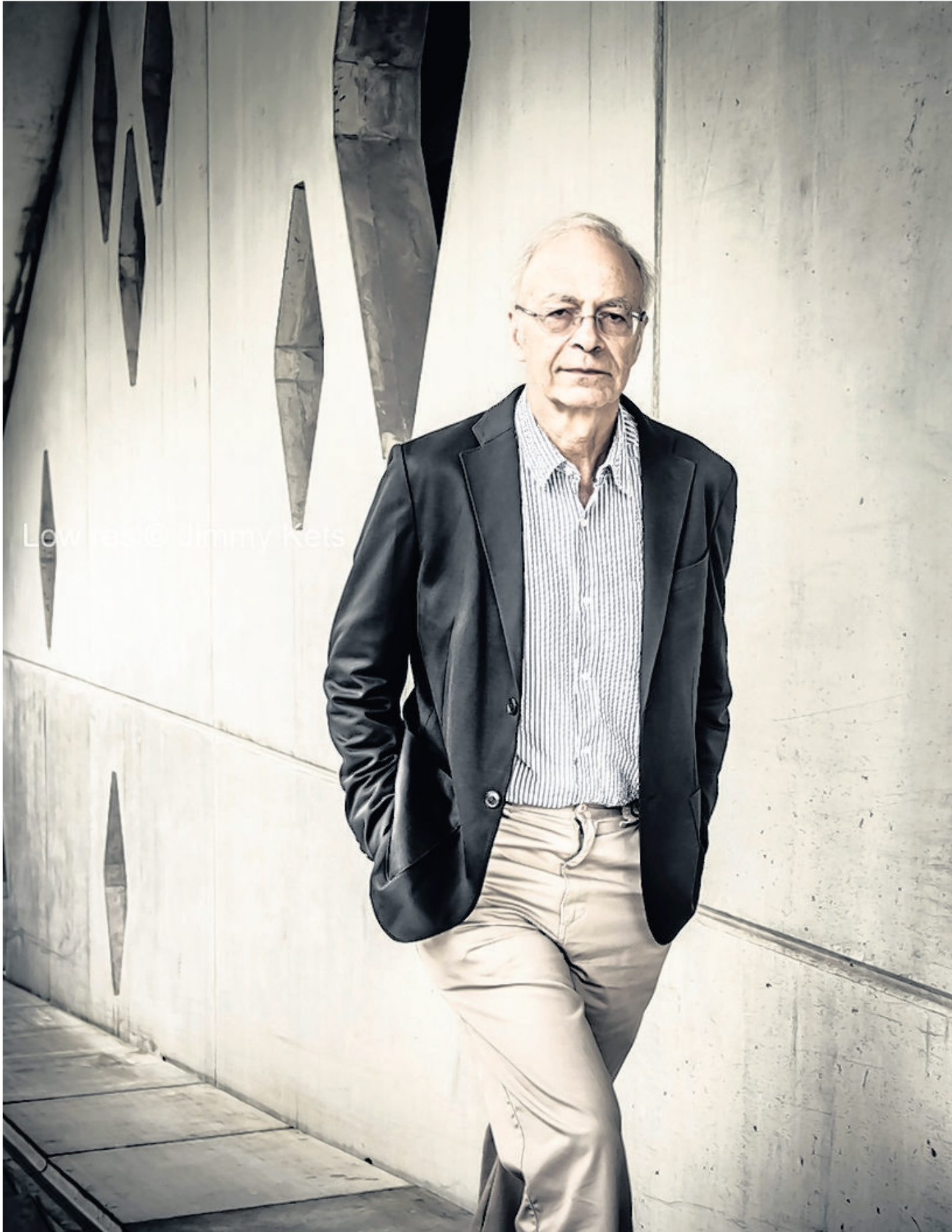
'Het gaat er om wat jij bereid bent met je rijkdom te doen.'